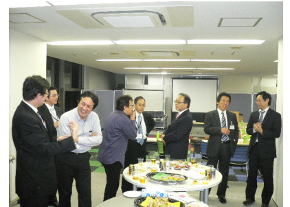
***** セミナー終了後、名刺交換会 & 交流会を開きます。

内容: 急増! 残業代不払いで会社のピンチ! さあ、どうする? これなら納得! 労基署も社員も認める残業代対策 問題社員の入社を未然防止する上手な雇入れ方法 就業規則の不備から発生するトラブル事例とその対策 他 90分