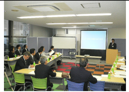
< 昨年のセミナー風景 >

内容: 経営戦略を考える4つのステップ 戦略策定ツール「戦略マップ」とは 戦略マップにおける4つの視点 他 60分