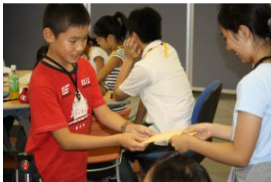
お疲れ様でした。 お給料です。