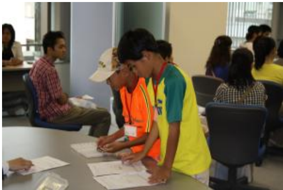
利益の10%を税務署に納めます