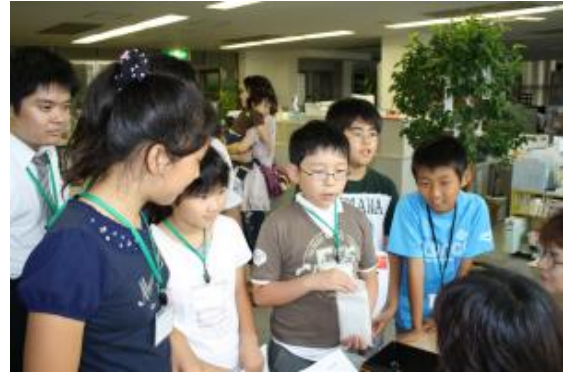
銀行に借りたお金を返済