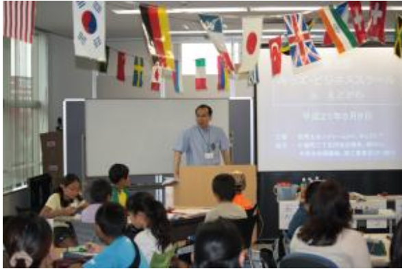
小学5・6年生23人が参加