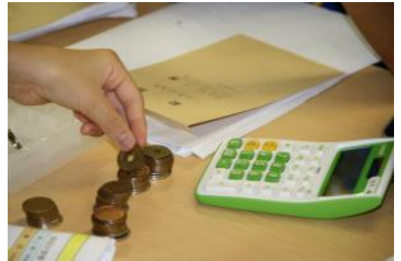
利益を等分します