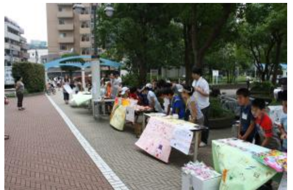
小島町二丁目団地一角にて