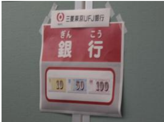
三菱東京UFJ銀行の方にお手伝いいただきました