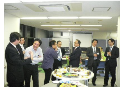
***** セミナー終了後、名刺交換会&交流会を開きます。