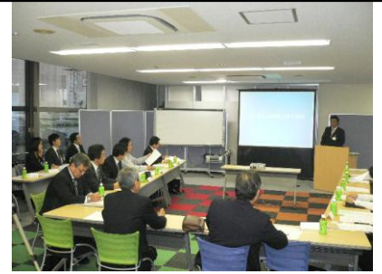
<過去のセミナー風景>